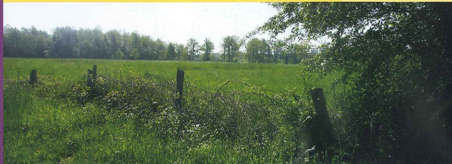
Circuit au départ du Centre équestre La Cavale - Saint-Victor-de-Chrétienville - Tél : 02 32 45 09 04

Circuit des environs de Bernay Distance : 13 km Durée : 2h à 1/2 journée Balisage : une partie sur GR26 Carte IGN : 1813 E et 1813 O